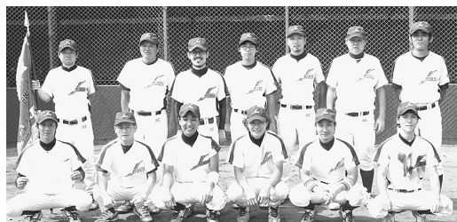
優勝 ジェイ・バス労働組合

優勝 ジェイ・バス労働組合(ジェイ・バス労組)、準優勝 不二工機(不二工機労組) 3位 関東バスターズ(関東自動車労組)、4位 ドウキーセブン(栃木県職員労働組合県庁支部)