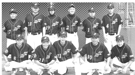
第3位 関東バスターズ(関東自動車労組)