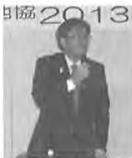
(連合栃木菊嶋副事務局長)