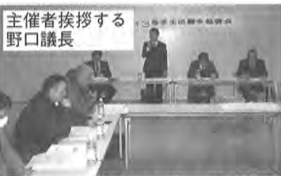
グループ討議の意見等