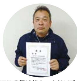
団体戦優勝代表：大杉副議長