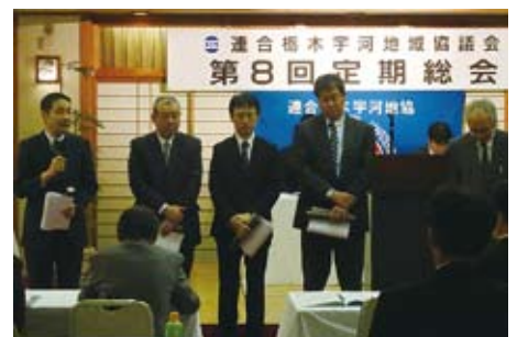
功労表彰の皆さん