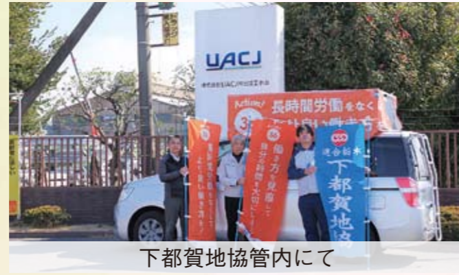
下都賀地協管内にて

毎年3月6日は、36 (サブロク) の日です。働いている人に残業をさせるためには「36 (サブロク) 協定」の締結が必要です。連合栃木ではこのサブロクの日、ラッピングした街宣車で県内を走行。36協定の大切さ、働き方の見直しをアピールしました。連合はすべての人々が安心して働き、暮らすことができる社会を一緒に実現をめざします。