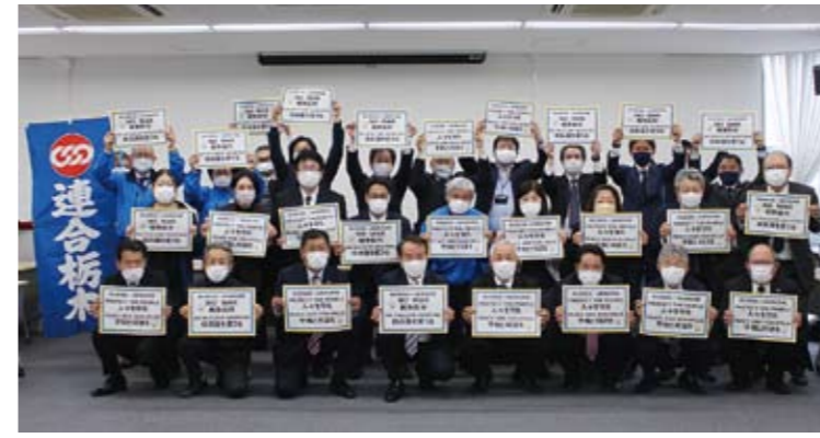
3月22日、連合栃木執行委員会にて撮影

RUSSIA - UKRAINE NO WAR 戦争反対 NO NUCLEAR WEAPONS 核兵器を使うな