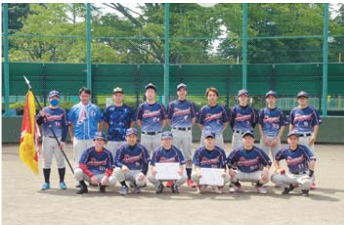
優勝：シグナルクラブ