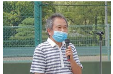
大杉副議長 閉会挨拶