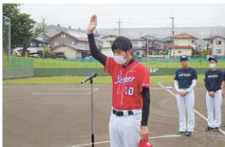
選手宣誓（JPイースト）