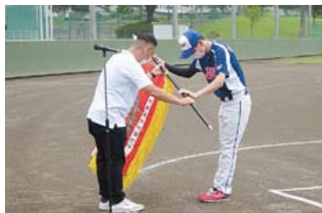
優勝旗返還（ジェイ・バス）