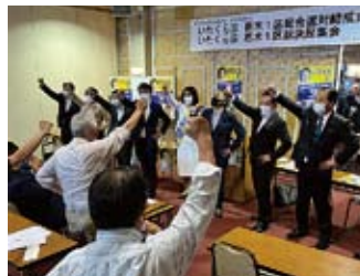
1 区宇河地域選対総決起集会