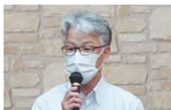
挨拶 (富山労金宇都宮支店長)