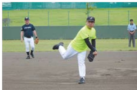
始球式（駒場国民県連代表）