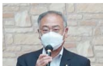
来賓挨拶 (駒場国民県連代表)