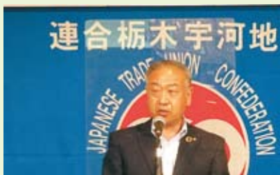
駒場国民県連代表挨拶