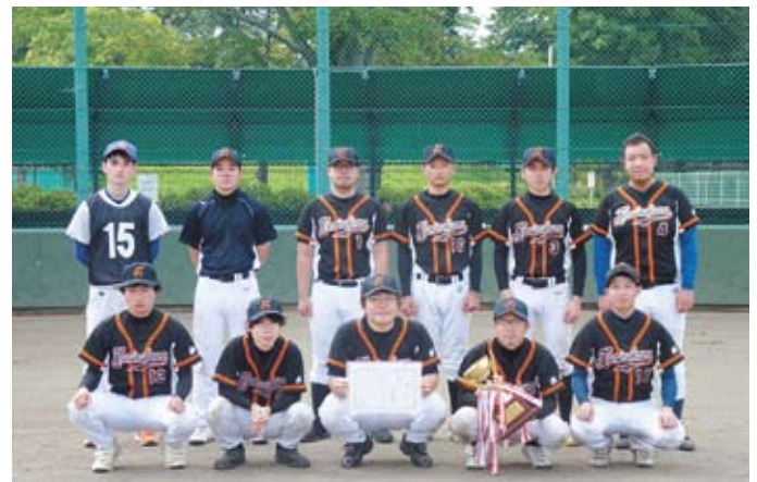
準優勝：上三川町役場