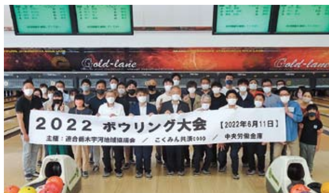
集 合 写 真