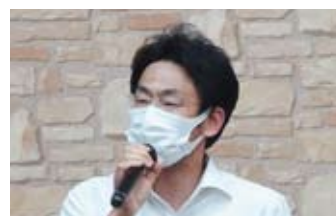
挨拶 (田野井労金宇都宮東支店長)