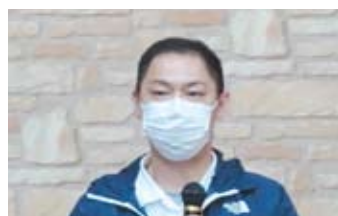
主催者挨拶 (市毛議長)