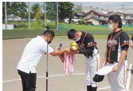
準優勝カップ授与