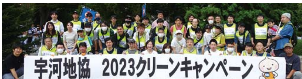
Cグループ(JAM 栃木、UA センセン、電機連合、全電線、政労連)