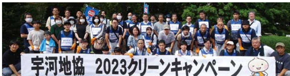
Bグループ (自治労、情報労連、私鉄総連、JR総連、運輸労連、国公総連)