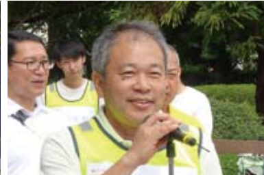
大杉副議長 注意事項説明