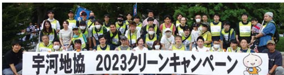
Cグループ (JAM 栃木、UA センセン、電機連合、全電線、政労連)