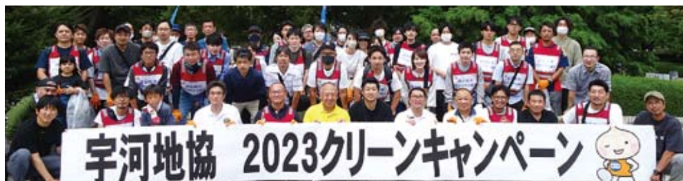
Aグループ (自動車総連、電力総連、フード連合、基幹労連、全労金、労済労連)