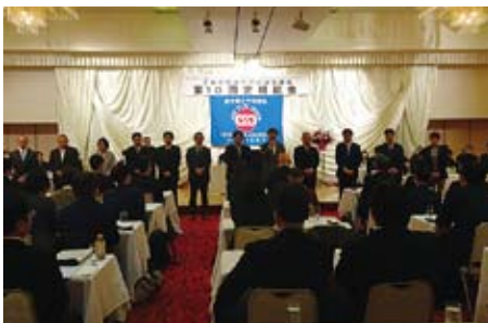
議員懇・上三川町議選推薦候補者紹介