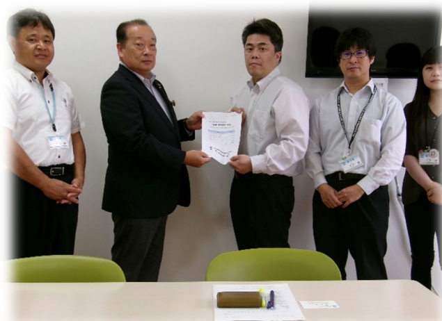
【益子町】 坂入副町長へ要求書を提出