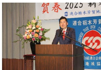
藤岡隆雄 衆議院議員