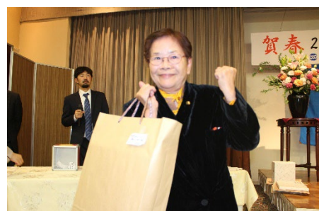
お楽しみ抽選会 (ろうきん賞)