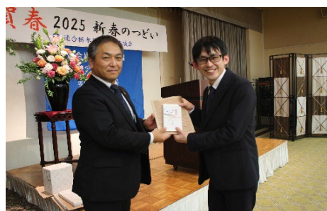
お楽しみ抽選会 (連合栃木会長賞)