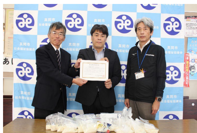
真岡市社協への贈呈式