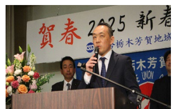
自動車総連栃木) 山口事務局長