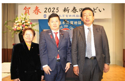
芳賀地協・議員懇の皆様