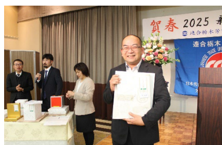
お楽しみ抽選会 (芳賀地協賞)