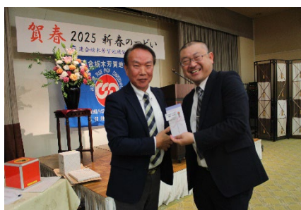
お楽しみ抽選会 (労福協会会長賞)