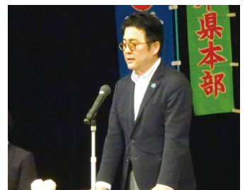
宮崎副議長 特別決議採択