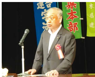
駒場国民県連代表挨拶