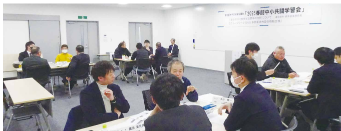
学習会でのグループワークの様子