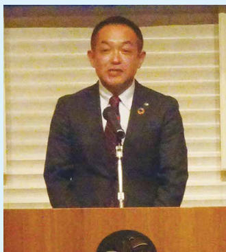
児玉事務局長挨拶