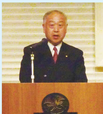
駒場国民県連代表挨拶