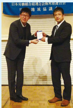
宇河地協議長賞当選者