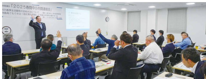
連絡会参加者の皆さん