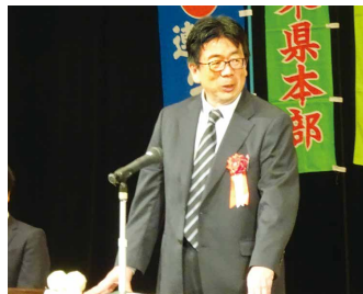
石塚会長代行挨拶