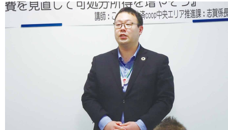
こくみん共済coop志賀係長