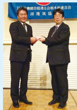
連合栃木会長賞当選者