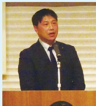
小池立憲県連幹事長挨拶