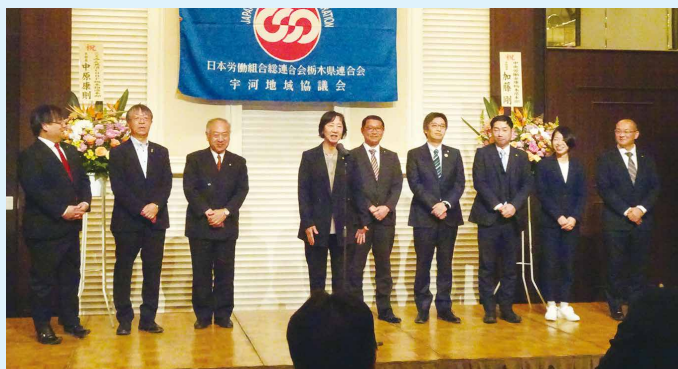
議員懇（市議・町議）紹介