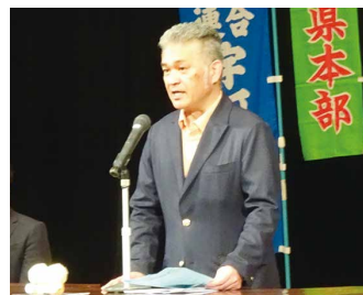
小田副議長 メーデー宣言採択