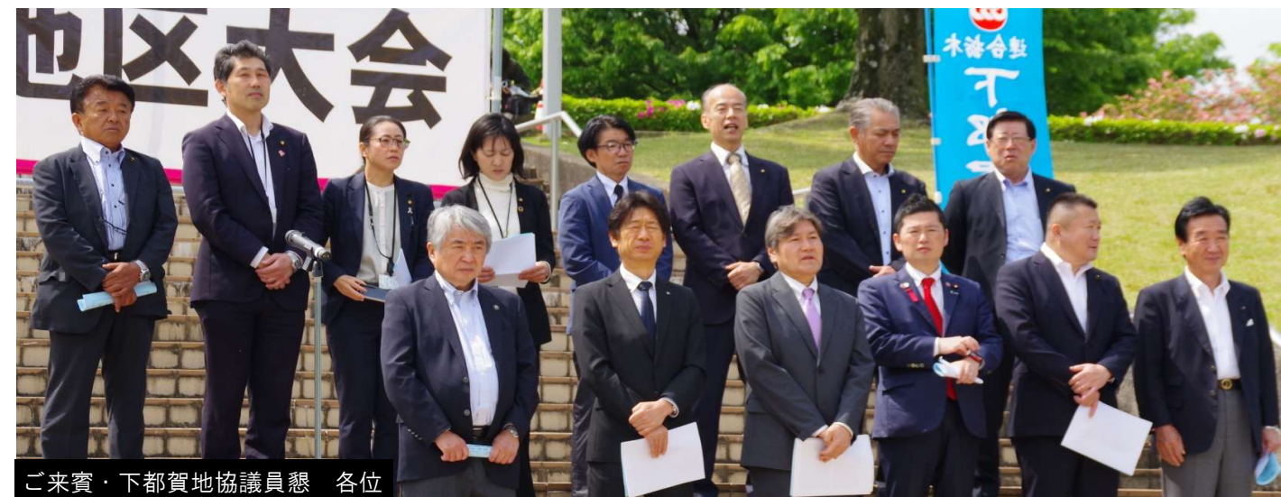
ご来賓・下都賀地協議員懇 各位

なお、メーデーに併せて実施した「苗木forいわき」支援カンパでは、94,918円を集約しました。皆さまのご協力に感謝申し上げます。