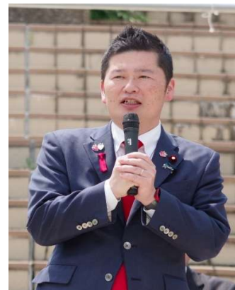
藤岡 隆雄 衆議院議員