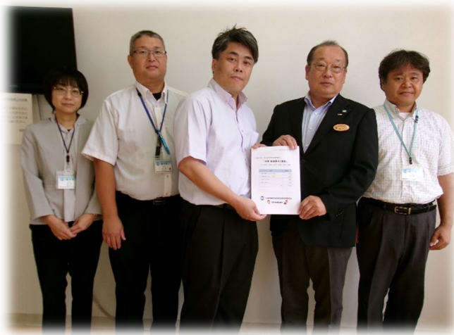
【益子町】 坂入副町長へ要求書提出