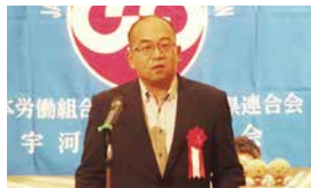
人見こくみん共済coop課長