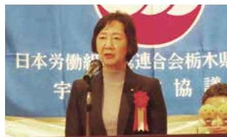
福田宇河地協議員懇会長