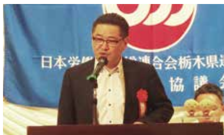
山崎労金宇都宮支店長