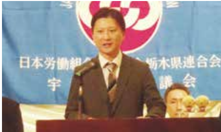
古川新議長代表挨拶