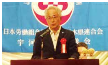
福田労福協事務局長