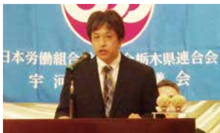
大金議長代表挨拶