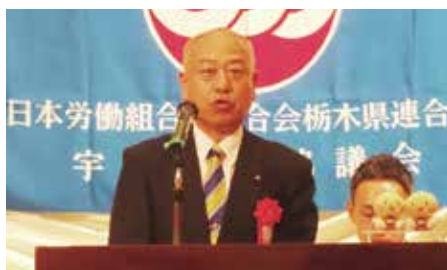
駒場国民県連代表