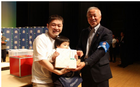
抽選会：連合栃木賞（NINTENDO SWITCH2）