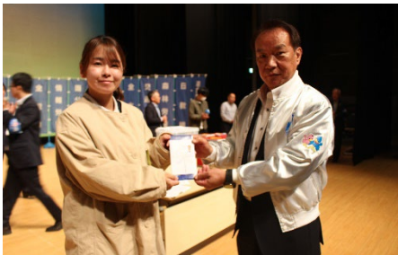
抽選会：労福協賞（JCB 商品券）