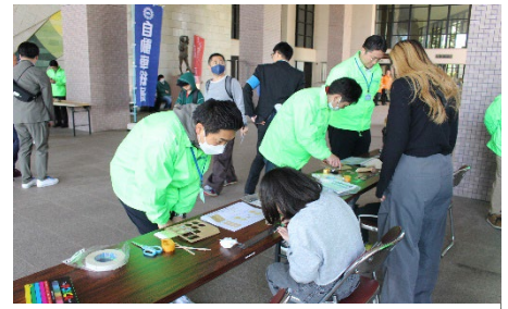
自動車総連親子deものづくり教室