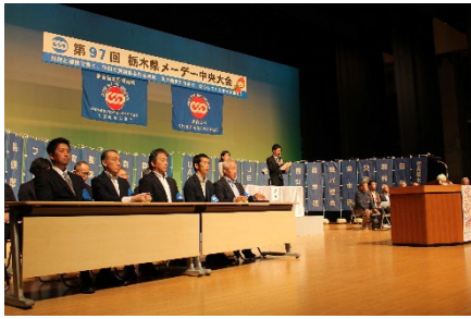
連合栃木・芳賀地協役員