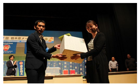
抽選会：芳賀地協賞（トースター）