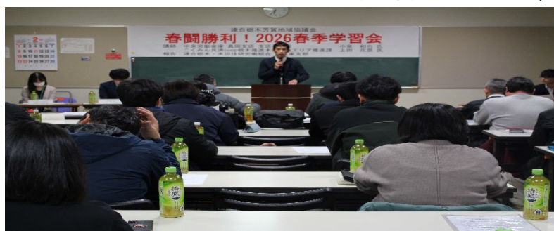
春闘勝利！2026 春季学習会