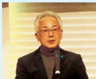
福田労福協事務局長挨拶