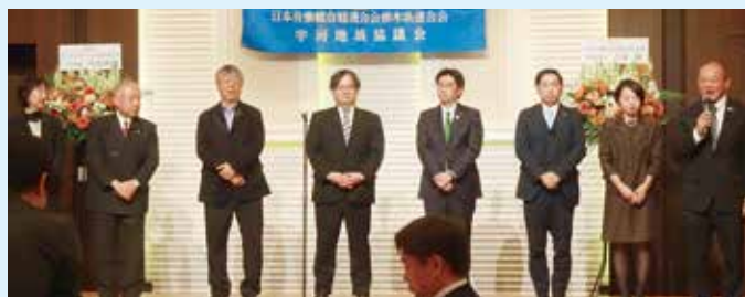
議員懇(市議・町議)紹介