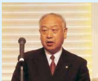
駒場国民県連代表挨拶