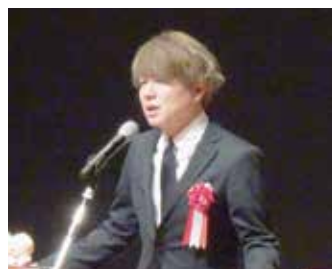
小笠原副会長挨拶