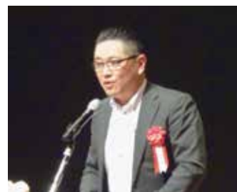
山崎労金宇都宮支店長挨拶