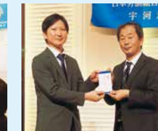
宇河地協議長賞当選者