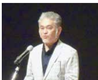
小田副議長 メーデー宣言採択