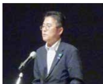
宮崎副議長 スローガン確認