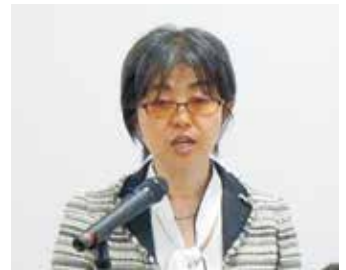
栃木労働局 天津室長