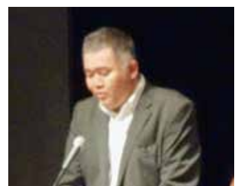
戸草内事務局長 司会