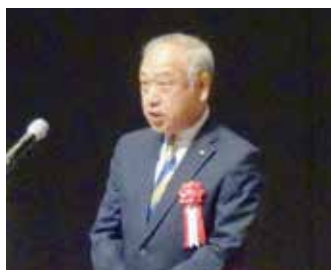
駒場国民県連代表挨拶