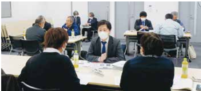
グループワークの様子(学習会)