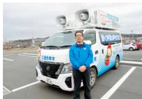
(宇河地区管内を運行)