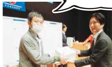
～ 抽選会の様子 ～