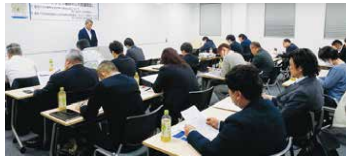
参加者の皆さん(連絡会)