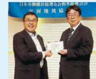
連合栃木会長賞当選者