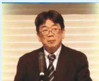
石塚会長代行挨拶