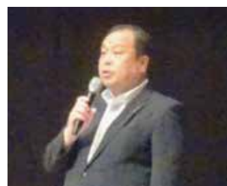
柴田事務局次長 大会議長挨拶